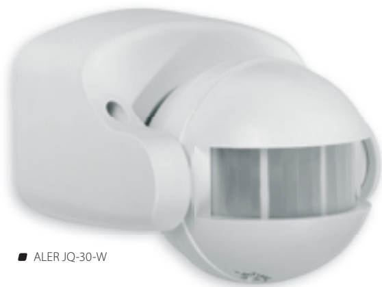
■ ALER JQ-30-W