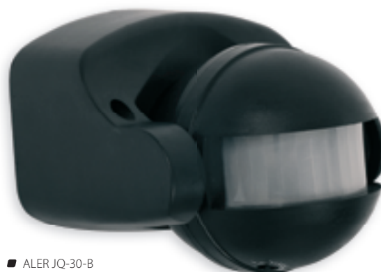
■ ALER JQ-30-B